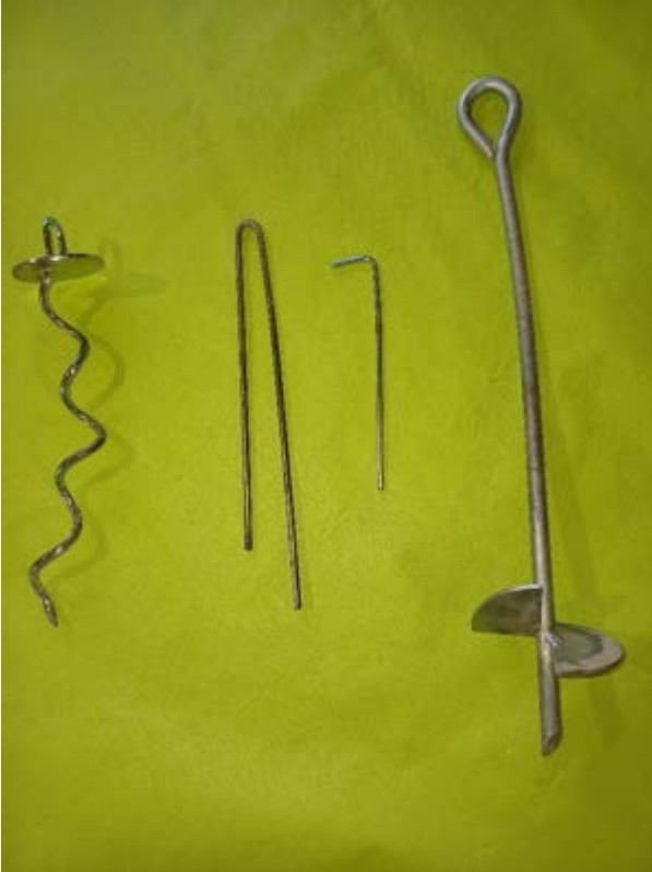
Kuva 15 Erilaisia kiinnityskiiloja rakenteille. Keskellä perusmallit ja reunoilla kierremallit.