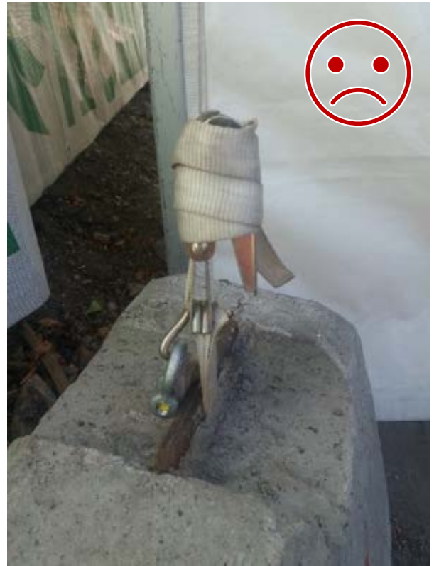
Kuva 6 EI NÄIN. Koukkua ei ole lukittu, tulisi olla sokkelilla lukittu kiinnityspisteeseen koukusta.