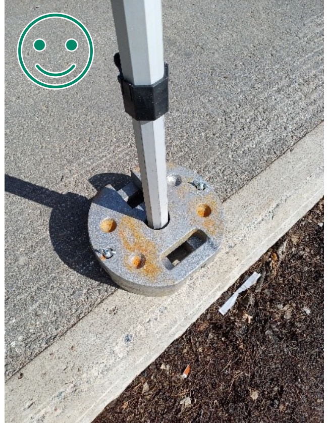
Kuva 2 HYVÄ TAPA. Molemmat painot kiinnitetty siipimutterilla molemmin puolin. Hevosenkämpäpainot vastakkain, jolloin tolppa ei pääse irtoamaan rakenteen liikuessa. Kulmatolpan maajalan tulee kestää kyseinen paino.