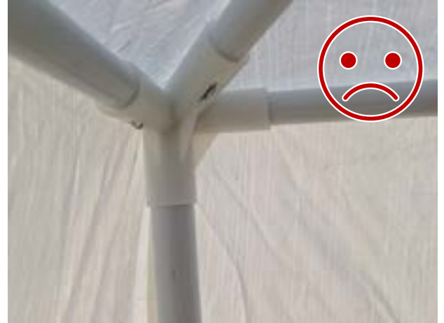
Kuva 13 Ei NÄIN. Kuluttajakäyttöön tarkoitettu rakenne. Putket eivät lukkiudu liitokseen.