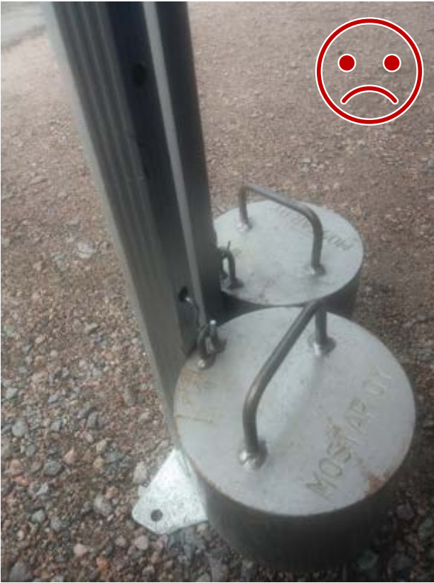
Kuva 9 EI NÄIN. Teräskoukku ei lukkiudu rakenteeseen. Lisäksi teräs leikkaa alumiinia nosteen ravistellessa telttaa.