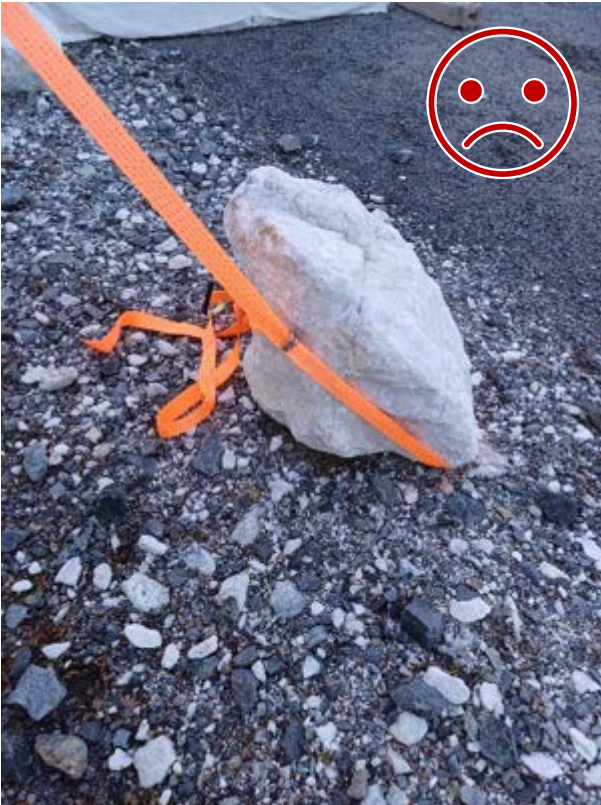
Kuva 5 EI NÄIN. Liinaa ei ole lukittu kiveen ja teräviä reunoja.