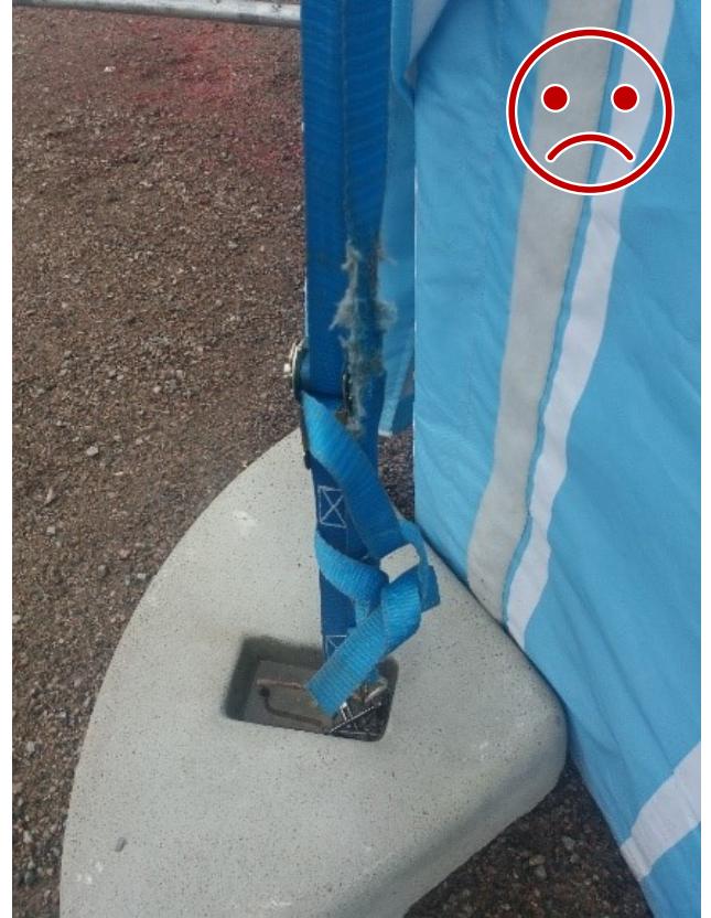
Kuva 10 EI NÄIN. Kuormaliina on kulunut.