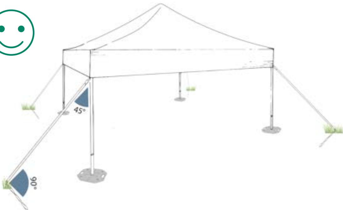
Kuva 16 MASTERTENT-teltan pystytyskuva, harusten, kiilojen sekä rakenteiden oikeasta kiinnitystavasta