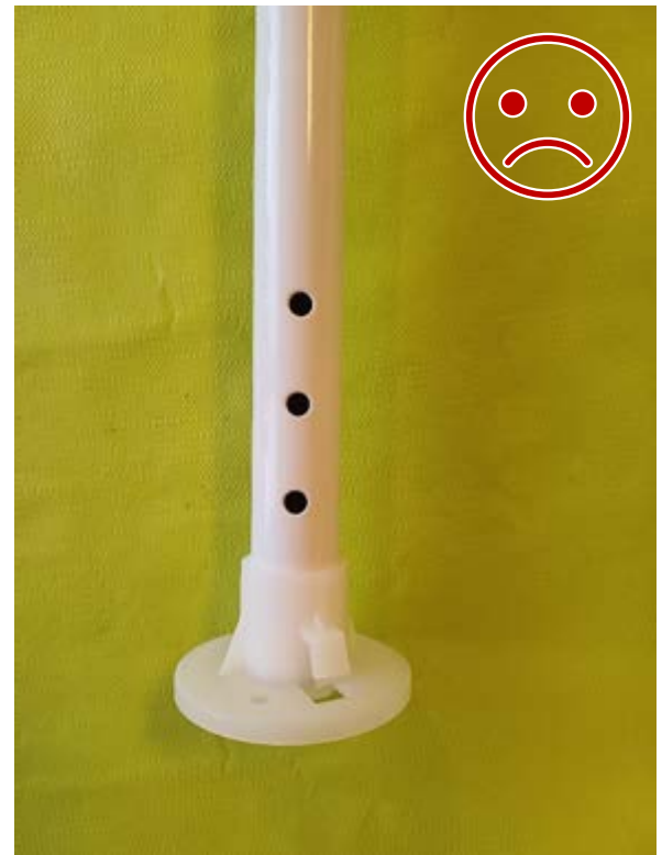
Kuva 14 Ei NÄIN. Kuluttajakäyttöön tarkoitettu rakenne. Muovinen tukijalka ei ole lukittu tolppaan, eikä kestä rasitusta.