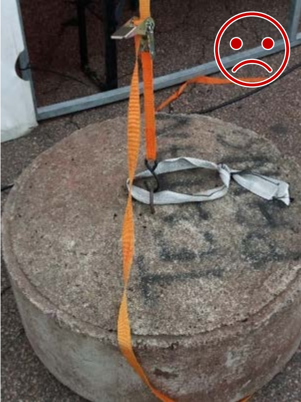
Kuva 7 EI NÄIN. S-koukku ei ole lukittava. Koukku irtoaa rakenteen liikkessa.