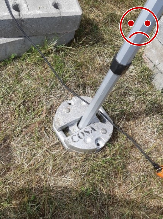
Kuva 1 EI NÄIN. Painojen lukitus toisiinsa puuttuu. Painot irtoavat painovoimaisesti, eivätkä pysy tolpan ympärillä tuulen ravistellessa telttaa.