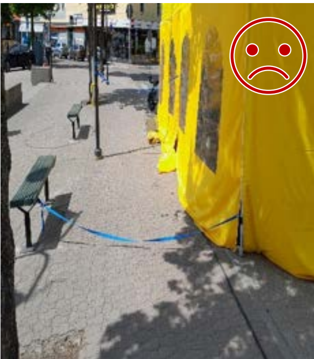
Kuva 12 Ei NÄIN. Vaakasuunnan kiinnitys ei estä telttaa nousemasta ilmaan. Liina aiheuttaa lisäksi kompastumisvaaraa.