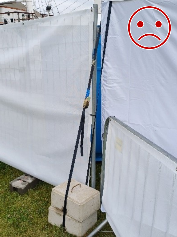
Kuva 11 Ei NÄIN. Painoja ei ole lukittu liinaan tai toisiinsa. Pino kaatuu eikä liina pidä rakenteen liikkessa.