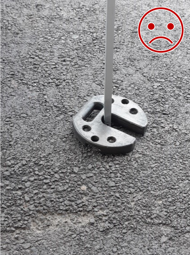
Kuva 3 EI NÄIN. Painoa ei ole lukittu rakenteeseen. Toinen paino päälle toiselta puolelta sekä painojen lukitseminen myös toisiinsa on tarpeen.