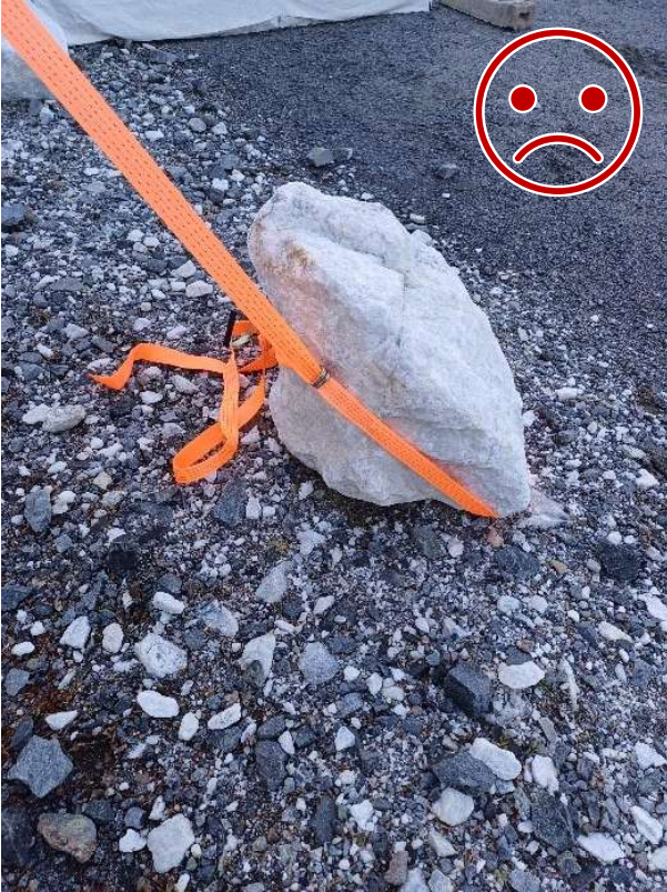
Kuva 5 EI NÄIN. Liinaa ei ole lukittu kiveen ja teräviä reunoja.