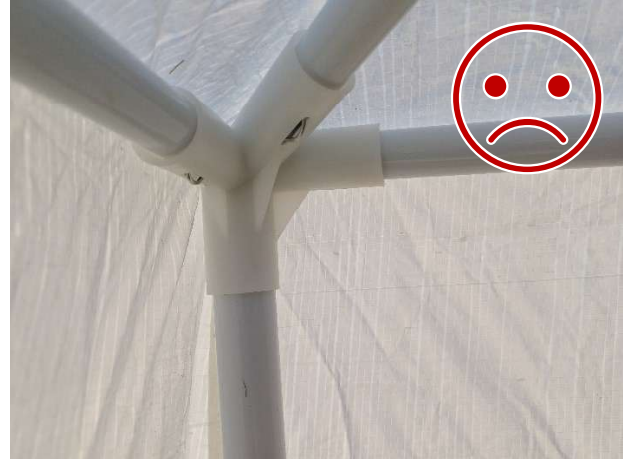
Kuva 13 EI NÄIN. Kuluttajakäyttöön tarkoitettu rakenne. Putket eivät lukkiudu liitokseen.