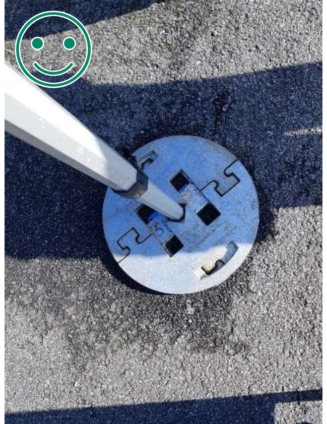
Kuva 4 HYVÄ TAPA. Kaksi kerrosta painoja vastasuuntaisesti. Lukitsevat kerrokset tolpan ympärille, kun tolpan aluslevy on riittävän kokoinen ja kiinteä. Kulmatolpan maajalan tulee kestää kyseinen paino.