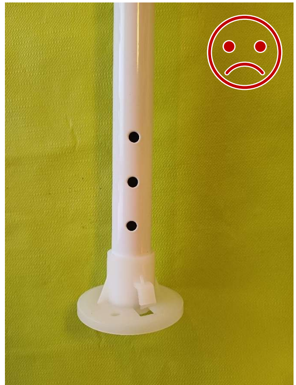
Kuva 14 EI NÄIN. Kuluttajakäyttöön tarkoitettu rakenne. Muovinen tukijalka ei ole lukittu tolppaan, eikä kestä rasitusta.