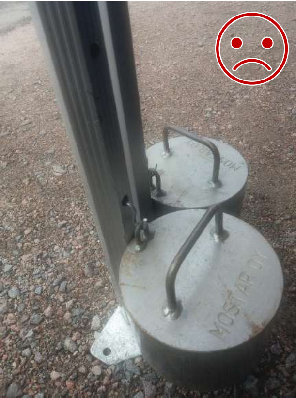
Kuva 9 EI NÄIN. Teräskoukku ei lukkiudu rakenteeseen. Lisäksi teräs leikkaa alumiinia nosteen ravistellessa telttää.