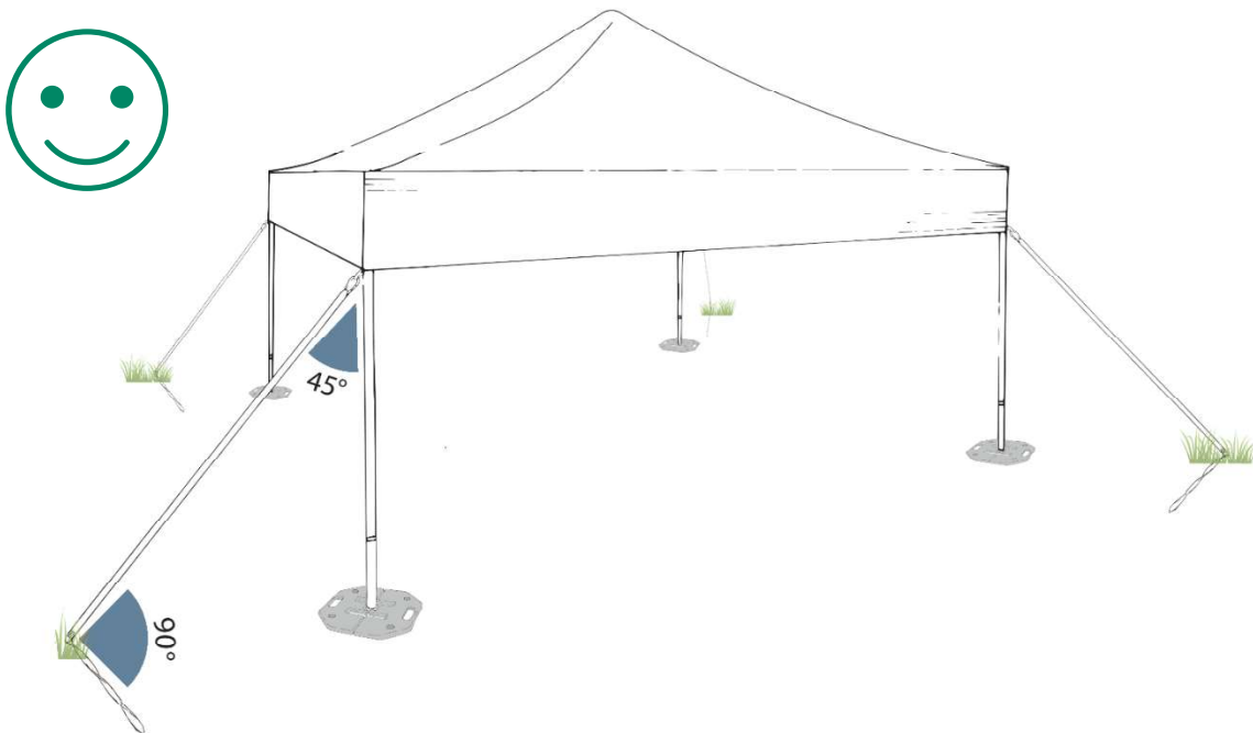
Kuva 16 MASTERTENT-teltan pystytyskuva, harusten, kiilojen sekä rakenteiden oikeasta kiinnitystavasta