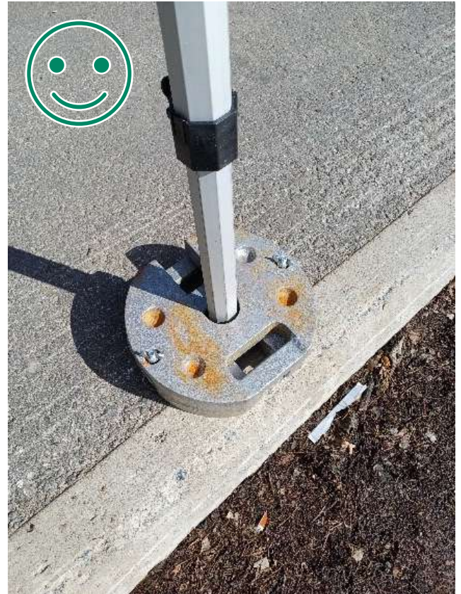
Kuva 2 HYVÄ TAPA. Molemmat painot kiinnitetty siipimutterilla molemmin puolin. Hevosenkenkäpainot vastakkain, jolloin tolppa ei pääse irtoamaan rakenteen liikuessa. Kulmatolpan maajalan tulee kestää kyseinen paino.