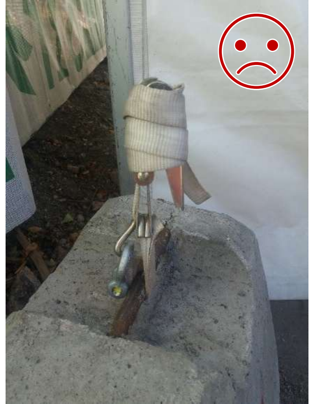
Kuva 6 EI NÄIN. Koukku ei ole lukittu, tulisi olla sokkelilla lukittu kiinnityspisteeseen koukusta.