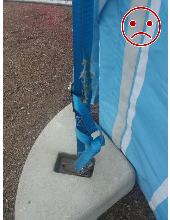
Kuva 10 EI NÄIN. Kuormaliina on kulunut.