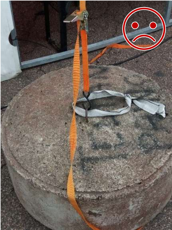
Kuva 7 EI NÄIN. S-koukku ei ole lukittava. Koukku irtoaa rakenteen liikkessa.