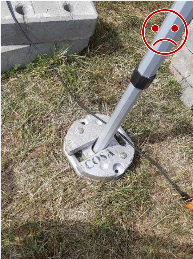
Kuva 1 EI NÄIN. Painojen lukitus toisiinsa puuttuu. Painot irtoavat painovoimaisesti, eivätkä pysy tolpan ympärillä tuulen ravistellessa teltaa.