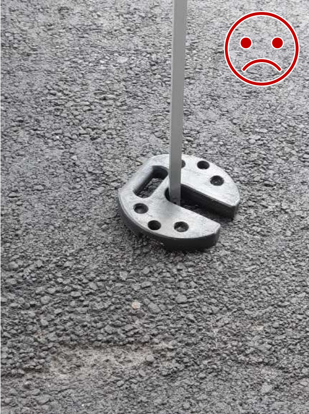
Kuva 3 EI NÄIN. Painoa ei ole lukittu rakenteeseen. Toinen paino päälle toiselta puolelta sekä painojen lukitseminen myös toisiinsa on tarpeen.