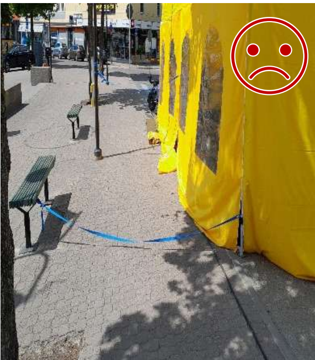
Kuva 12 EI NÄIN. Vaakasuunnan kiinnitys ei estä telttaa nousemasta ilmaan. Liina aiheuttaa lisäksi kompastumisvaaraa.