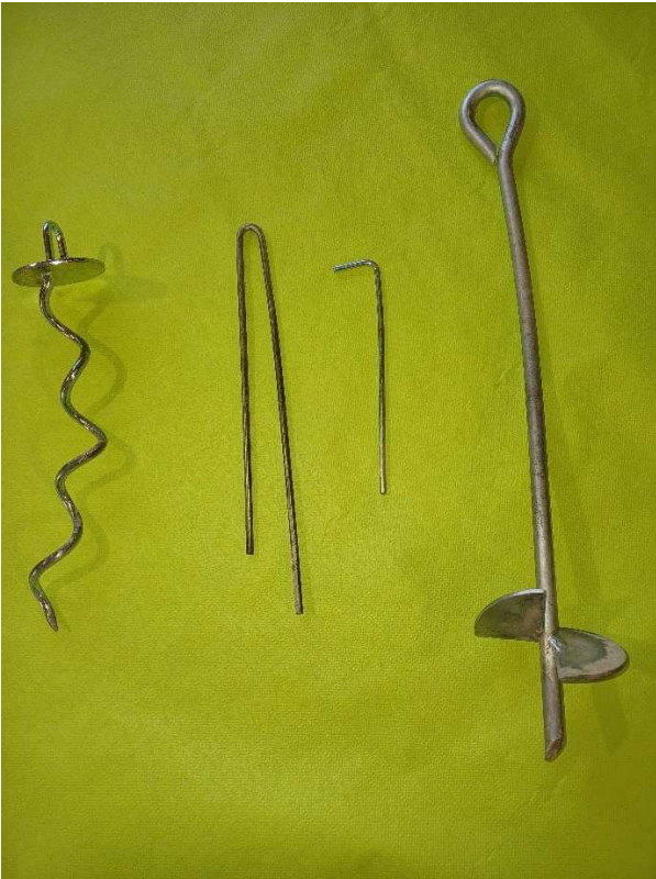
Kuva 15 Erilaisia kiinnityskiiloja rakenteille. Keskellä perusmallit ja reunoilla kierremallit.