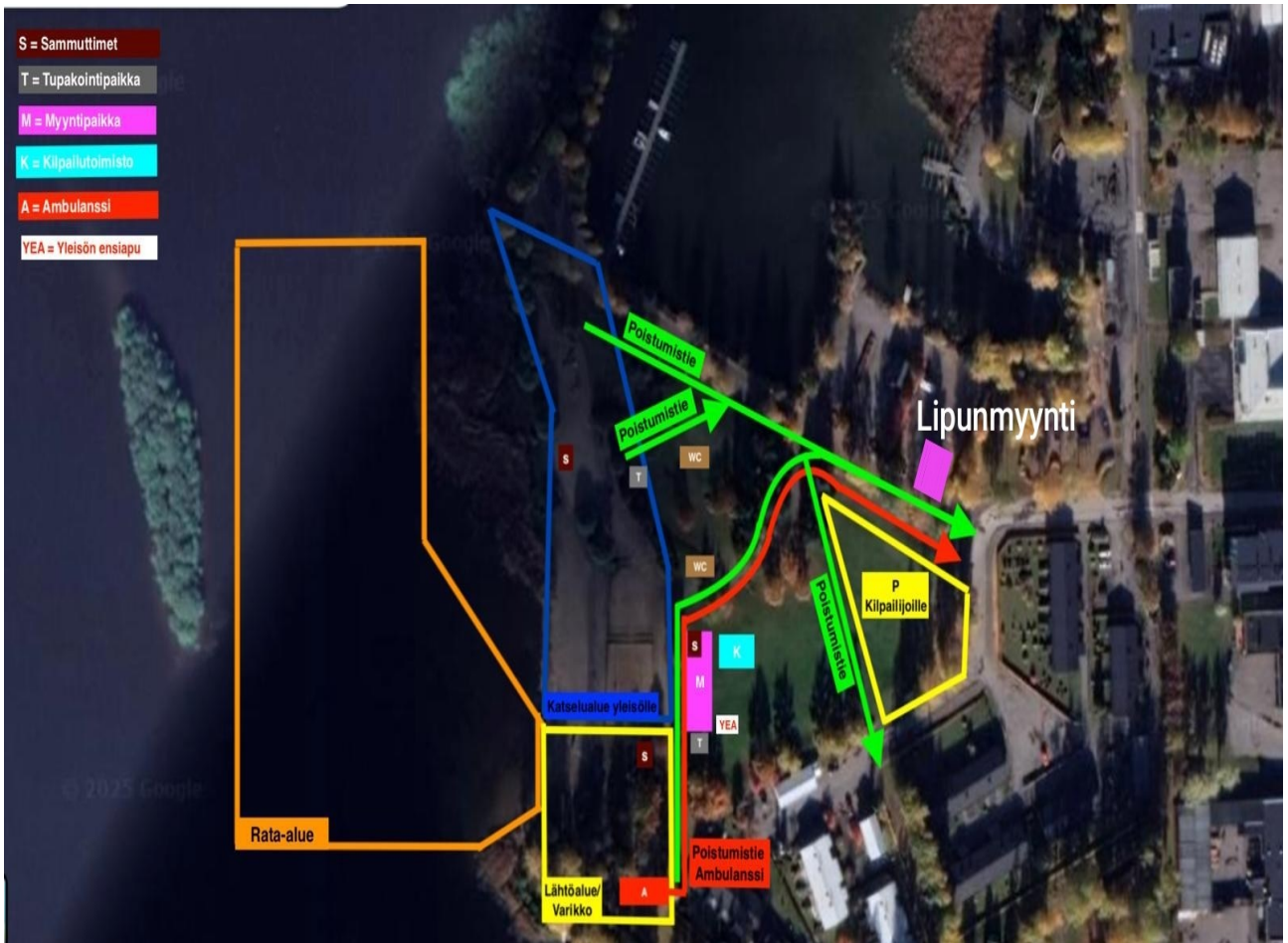
Tapahtuma-alueen pohjakuva. Varikolla myös vessat.